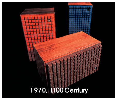
1970. L100 Century

● キャビネット内部に適切なブレイシングを施し剛性が強化されたキャビネットは、JBL伝統のウォールナット突板仕上げ。